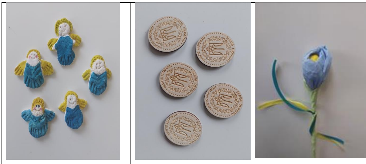
1 foto. Rankdarbiai pagaminti Anykščių Antano Vienuolio progimnazijos mokinių

Smagu, kad dalyvauti šioje akcijoje nutarė dalyvauti maži vaikai, Anykščių vaikų lopšelio darželio „Spindulėlis“ ugdytiniai. 4-6 metų vaikai kartu su mokytojų pagalba, jie piešė, lipdė, darė rankdarbius, o vėliau pardavė juos savo tėveliams. Tai gražaus bendradarbiavimo su tėvais pavyzdys, kai graži idėja įtraukia tėvus į mokyklos veiklas.