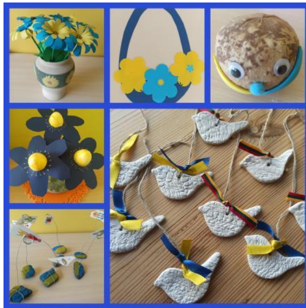
2 foto. Rankdarbiai pagaminti Anykščių lopšelio-darželio „Spindulėlis“ vaikų